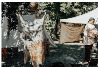
Römer- und Keltenfest Pachten 2

Doch nicht erst die Römer erkannten die günstige Lage des Ortes. Bereits in der älteren Hallstattzeit entstand eine Höhenbefestigung auf dem