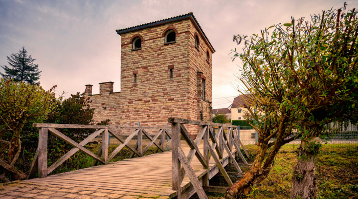
Römerpark Pachten 1