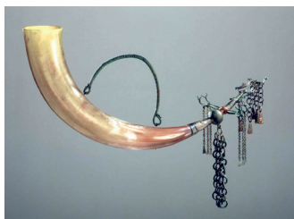
Trinkhorn, Kappel am Rhein 2